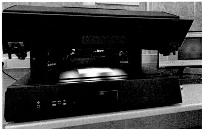
Иллюстрация 1. Общий вид видеоспектрального компаратора «Регула» 4308S.