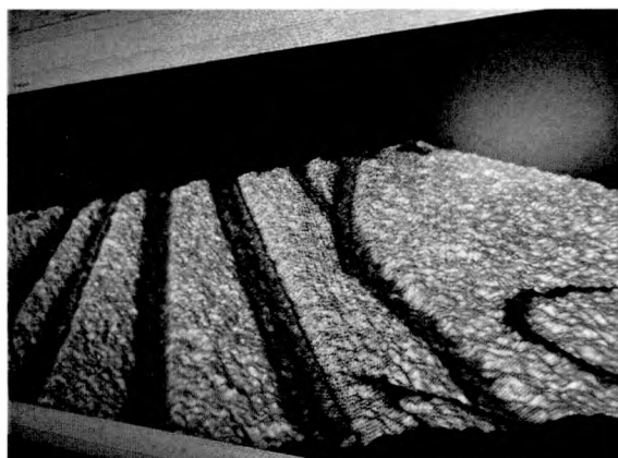
Иллюстрация 3. 3-D модель рукописных штрихов, выполненных перьевыми ручками.