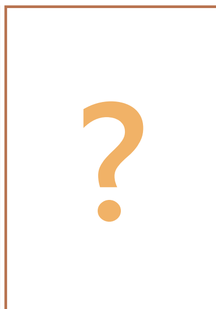
Ответ на обложке июньского номера журнала

Совет молодых адвокатов Нижегородской области организует очередной конкурс «Мисс адвокатура Нижегородской области 2018». Его проведение приурочено к празднованию Дня адвокатуры, отмечаемого адвокатским сообществом России 31 мая. Желаям заявиться на участие в конкурсе и тем, кто хотел бы помочь мероприятию, предложено обращаться в СМА (контакты на сайте www.sma-nn.ru ).