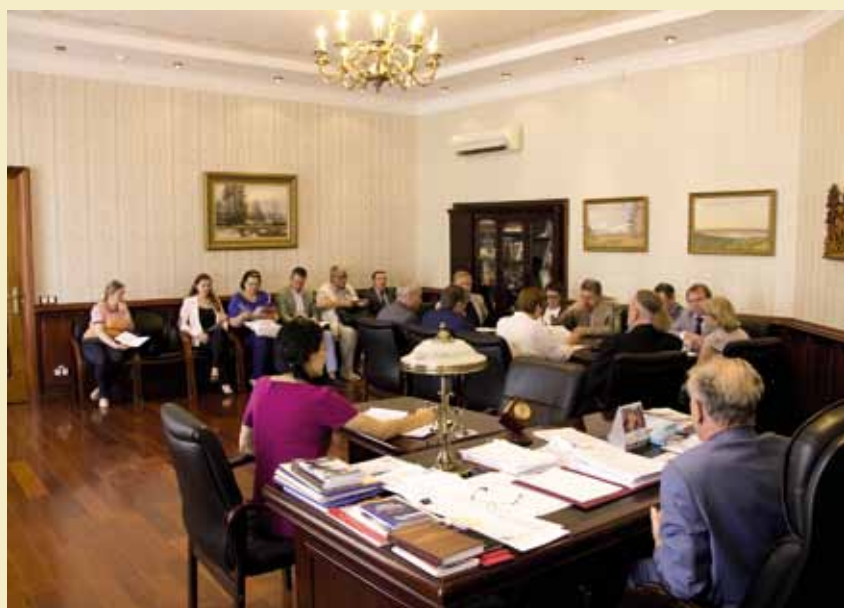
На фото: заседает совет Палаты адвокатов Нижегородской области.