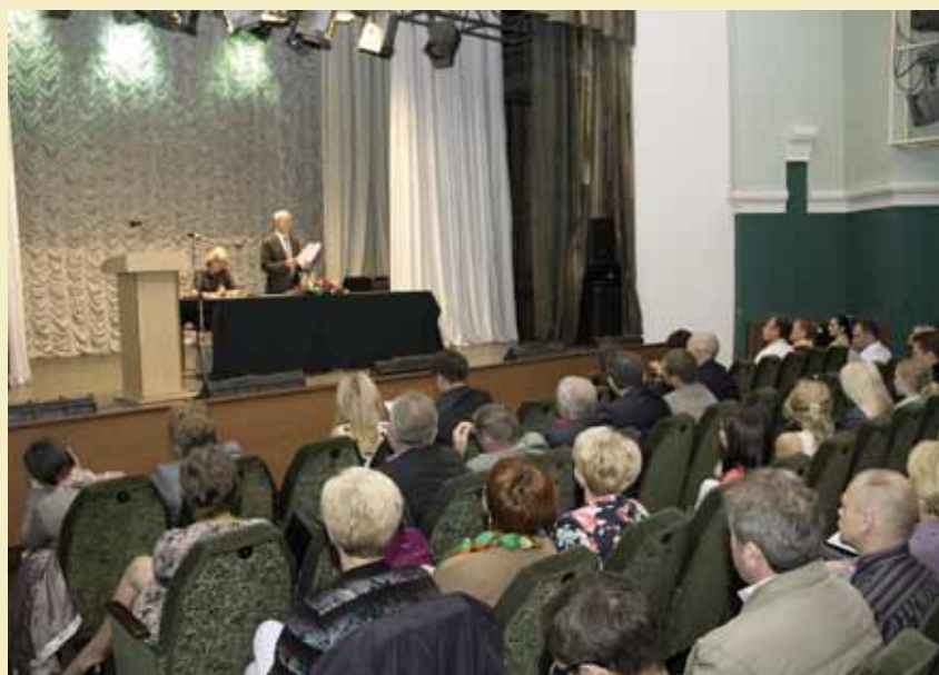
На фото: Внеочередная конференция адвокатов Нижегородской области.

Другим событием стало расширенное заседание совета адвокатской палаты, на котором поднимался вопрос о задолженности судебного департамента по оплате труда адвокатам за работу по делам по назначению.