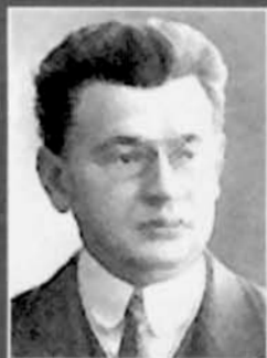
А. Аверченко [1882-1925]