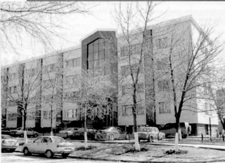
В этом здании располагается Палата адвокатов Самарской области

Печатается с незначительными сокращениями. Приводится по источнику: «Вестник палаты адвокатов Самарской области» № 2(8) 2006 г.