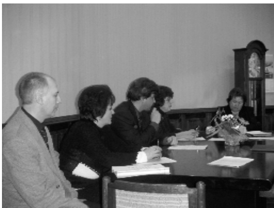
На снимке: первое заседание президиума в новом составе

В этом году произведена ротация членов президиума. Состав его значительно поменялся. Неизменным остался тем его работы.