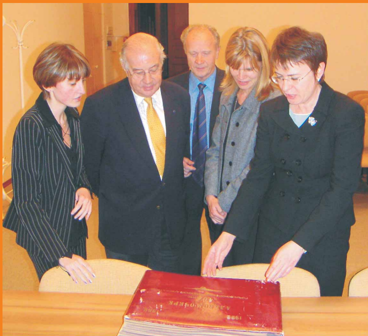
Гости познакомились с историей Нижегородской областной коллегии адвокатов

Через день, 16 ноября, начал работу семинар на тему «Защита лиц, лишенных свободы». (При этом понятие лишение свободы следует понимать в его исконном значении, а не в привычном для юристов узком смысле как «меру наказания»).