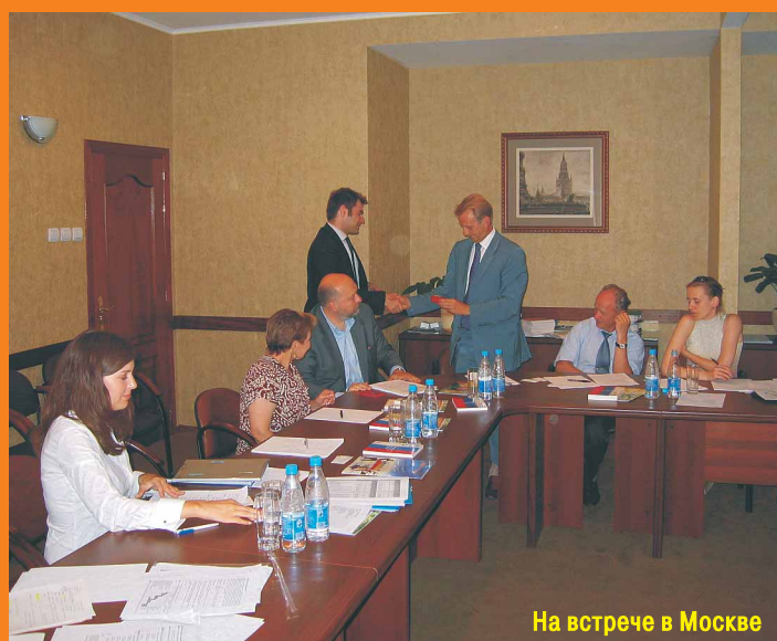
На встрече в Москве