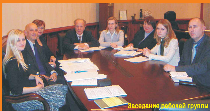
Заседание рабочей группы

солиситоров (адвокатов, допущенных к ведению дел в судах 1 инстанции) и 15 000 барриситоров (адвокатов, допущенных к ведению дел в высших инстанциях). М-р Роджер прокомментировал это так: «наша адвокатура убедил бизнес сообщество в том, что к адвокату надо обращаться каждый раз, перед тем как заключить сделку, а не только тогда, когда возникает спор».