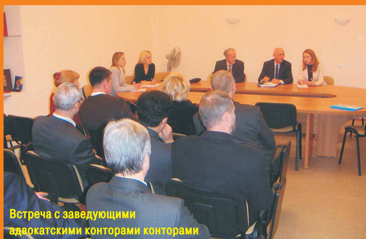
Встреча с заведующими адвокатскими конторами конторами