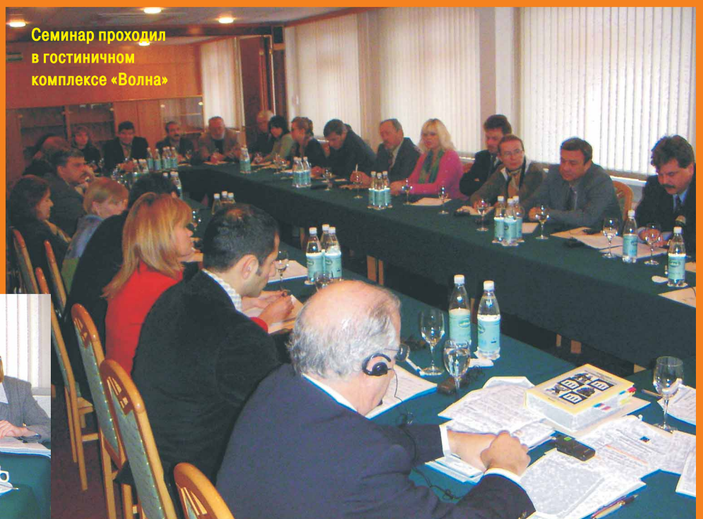
Семинар проходил в гостиничном комплексе «Волна»